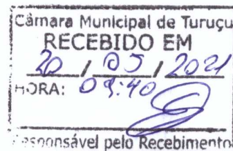
Ivan Eduardo Scherdien Prefeito Municipal de Turuçu