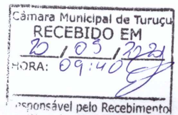
Ivan Eduardo Scherdien Prefeito Municipal de Turuçu